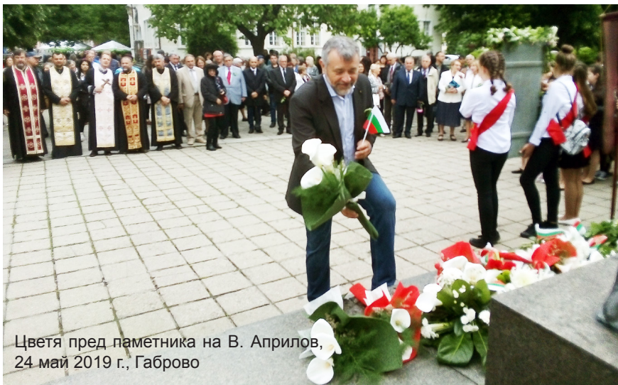
Цветя пред паметника на В. Априлов, 24 май 2019 г., Габрово

„И НИЙ СМЕ ДАЛИ НЕЩО НА СВЕТА – НА ВСИ СЛОВЕНЕ КНИГИ ДА ЧЕТАТ“...“