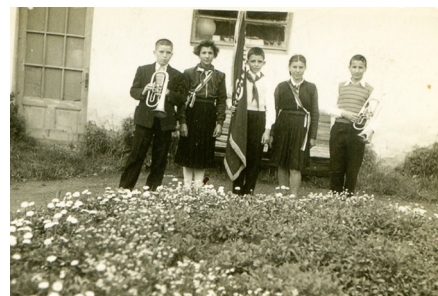
Ден на народните будители, 1930 година

Дават се указания делото на възрожденците да се свърже с делото на народните партизани и антифа-