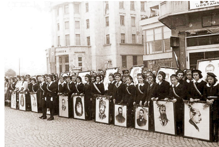
Ден на народните будители, 1939 година

шистката борба, да се пропагандират най-вече техните идеи за Балканско споразумение и побратимяване. Наред с портретите на народните будители по време на това последно