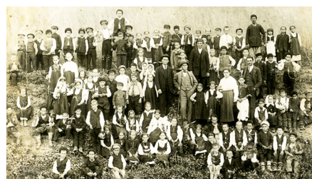
Ден на народните будители, 1920 година

При коренно променените политически реалности в края на 1944 г. националната идея е изместена от тази за братското сътрудничество с балканските народи. Навсякъде, отново и главно по линия на просветните учреждения, на 1 ноември се организират утра, вечеринки, манифестации,