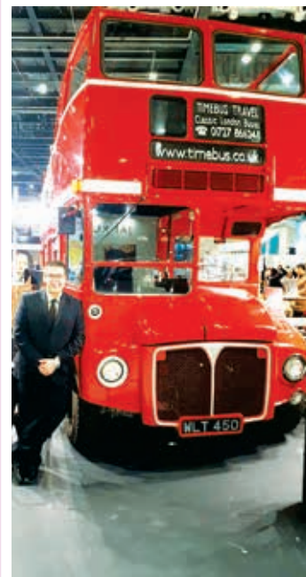
Мисля, че европейският опит, който придобих, е капитал, който ще ми бъде особено полезен за бъдещото ми професионално развитие.

Искам да насърча всички колеги да не се страхуват да предприемат стъпка за участие в „Еразъм +“ и вярвам, че ще се върнат у дома с още по интересни впечатления от Великобритания.