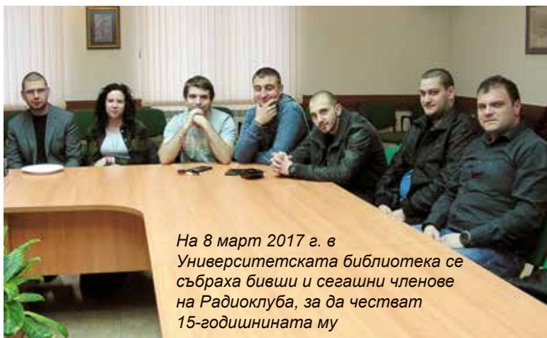
На 8 март 2017 г. в Университетската библиотека се събраха бивши и сегашни членове на Радиоклуба, за да честват 15-годишнината му