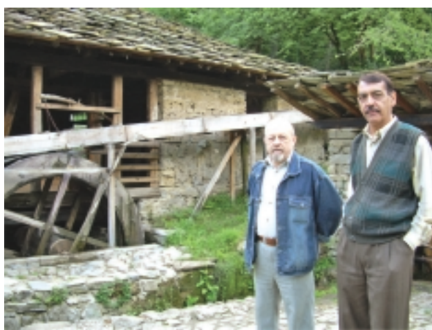
На разходка в АЕК „Етъра“