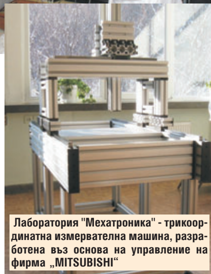
Лаборатория "Мехатроника" - трикоординатна измервателна машина, разработена въз основа на управление на фирма „MITSUBISHI“