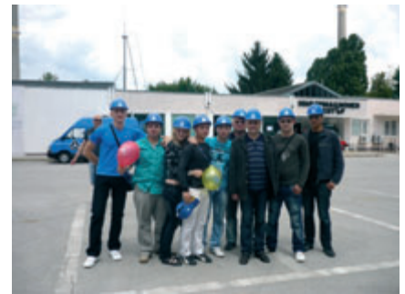
Студенти в АЕЦ „Козлодуй“