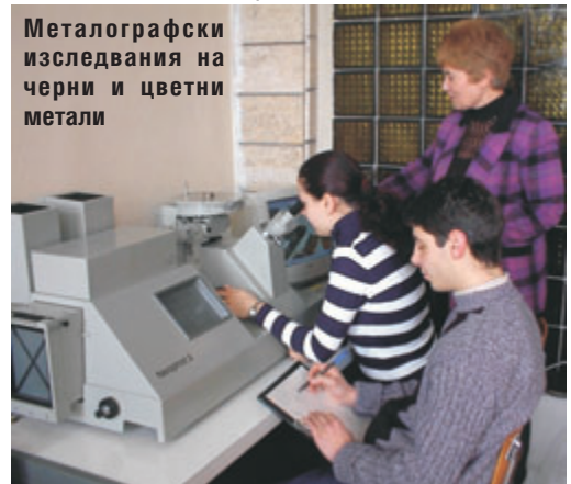
Металографски изследвания на черни и цветни метали

Области на реализация: Проектиране, оптимизиране и контрол на технологични процеси и инструментална екипировка; осъществяване на маркетингова и мениджърска дейност за получаване на материали и изделия.