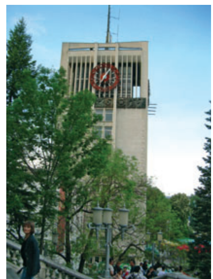
Община Габрово, часовникова кула

Области на реализация: Система на държавната администрация и местно самоуправление; ор-