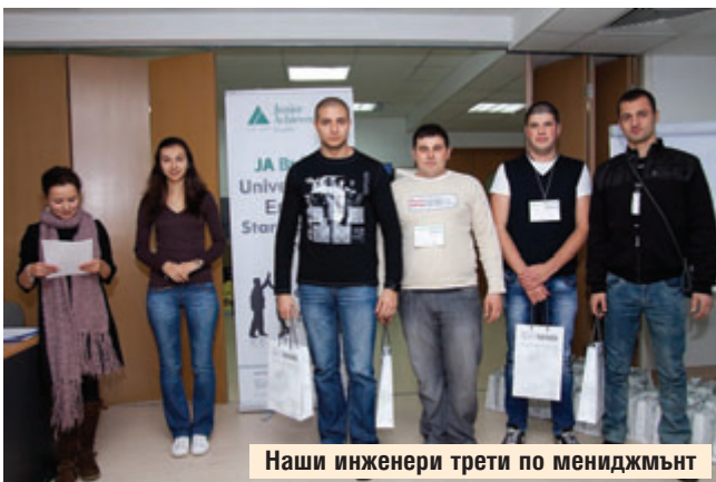
Наши инженери трети по мениджмънт