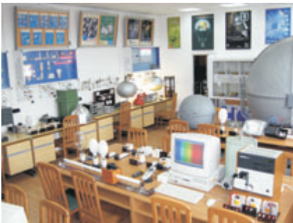
Лаборатория „ОСВЕТИТЕЛНА ТЕХНИКА“

Области на реализация: Проектиране, разработка и експлоатация на електроенергийни уредби, мрежи и съоръжения; възобновяеми енергийни източници; енергоефективни елементи и технологии; управление на енергийни обекти и системи.