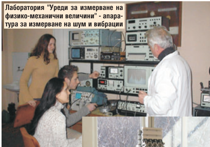
Лаборатория "Уреди за измерване на физико-механични величини" - апаратура за измерване на шум и вибрации

Катедра МУ е профилираща за специалностите „Мехатроника“ и „Техника и технологии за опазване на околната среда“ /ТООС/.