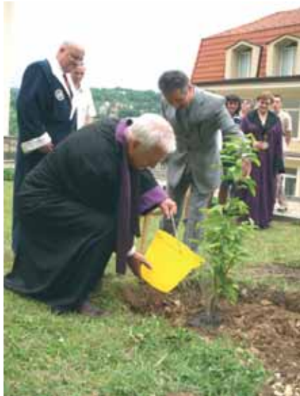
Накрая всички засадиха магнолия в двора на Ректората

„Иновативни лазерни технологии“ с участие на студенти и докторанти от четири държави: България (ТУ - Габрово), Германия (Университет за приложни науки Митвайда), Турция (Тракийски университет в Одрин и Университета в Ко-