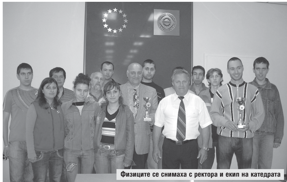
Физиците се снимаха с ректора и екип на катедрата

Когато е на 17 години се записва в новосъздадения шахматен клуб в Трявна.