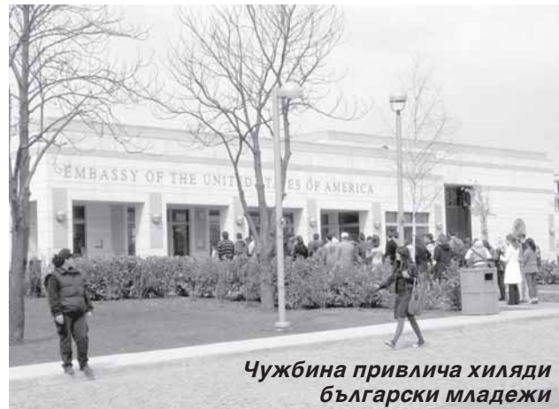
Чужбина привлича хиляди български младежи

- Най-напред да анализират своите силни и слаби страни, да решат в кой сектор искат да градят кариера. Да са от-