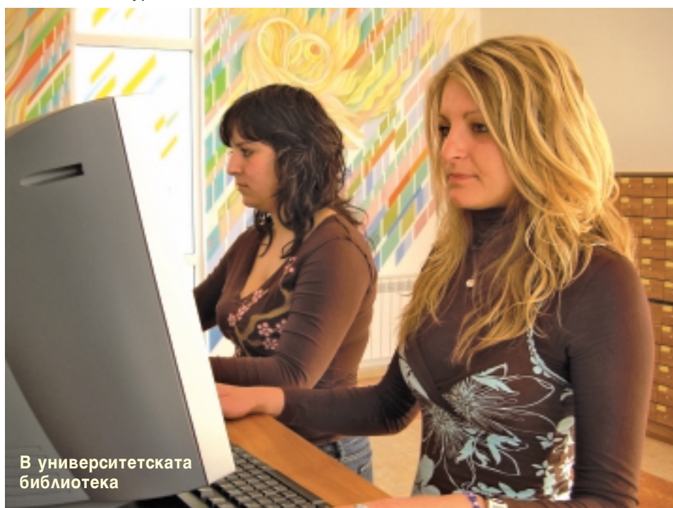
В университетската библиотека

В библиотеката може да се ползва всякаква електронно базирана информация - учебници, учебни пособия и други издания на CD или DVD-носители, осигурен е оп-