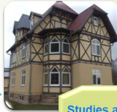
Studies at Partner University