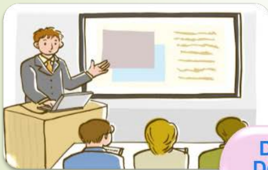
Diploma Thesis Defense at Home University