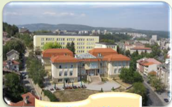
Studies at Home University